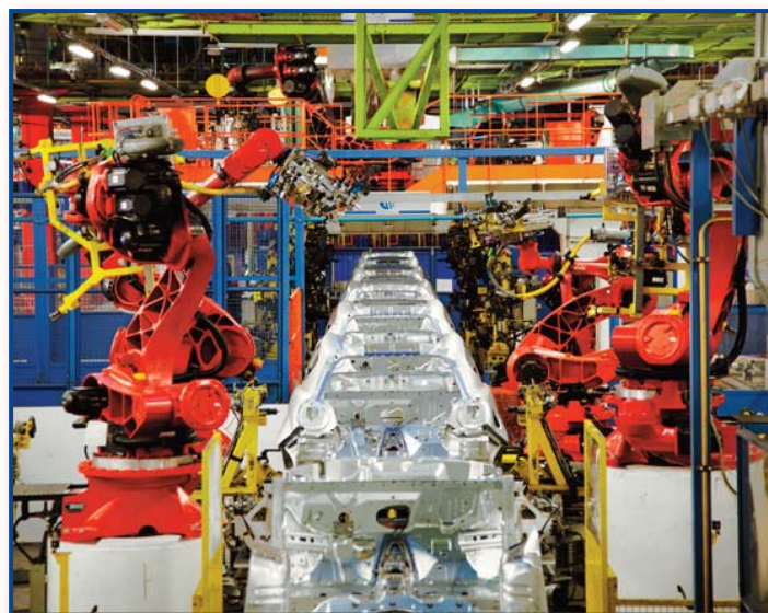
Mirafiori Carrozzeria, "Lastratura Mito"

C ompito del sindacato è ora quello di premere sul succitato "management" perché ciò si realizzi prima di quanto dichiarato. La Fiom protesta perché la Fiat è uscita da Confindustria. Anche a noi è parsa una determinazione che non aiuta l'insieme dei rapporti confederali e quelli delle singole rappresentanze in