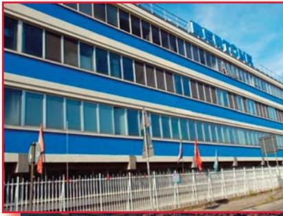
A sinistra: Officine automobilistiche Grugliasco in basso: lo stabilimento di Pomigliano