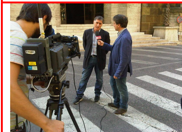
Il leader della Uilm risponde a RaiNews24